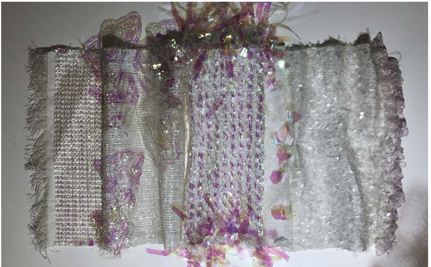
Expérimentations tissages du projet Empereur