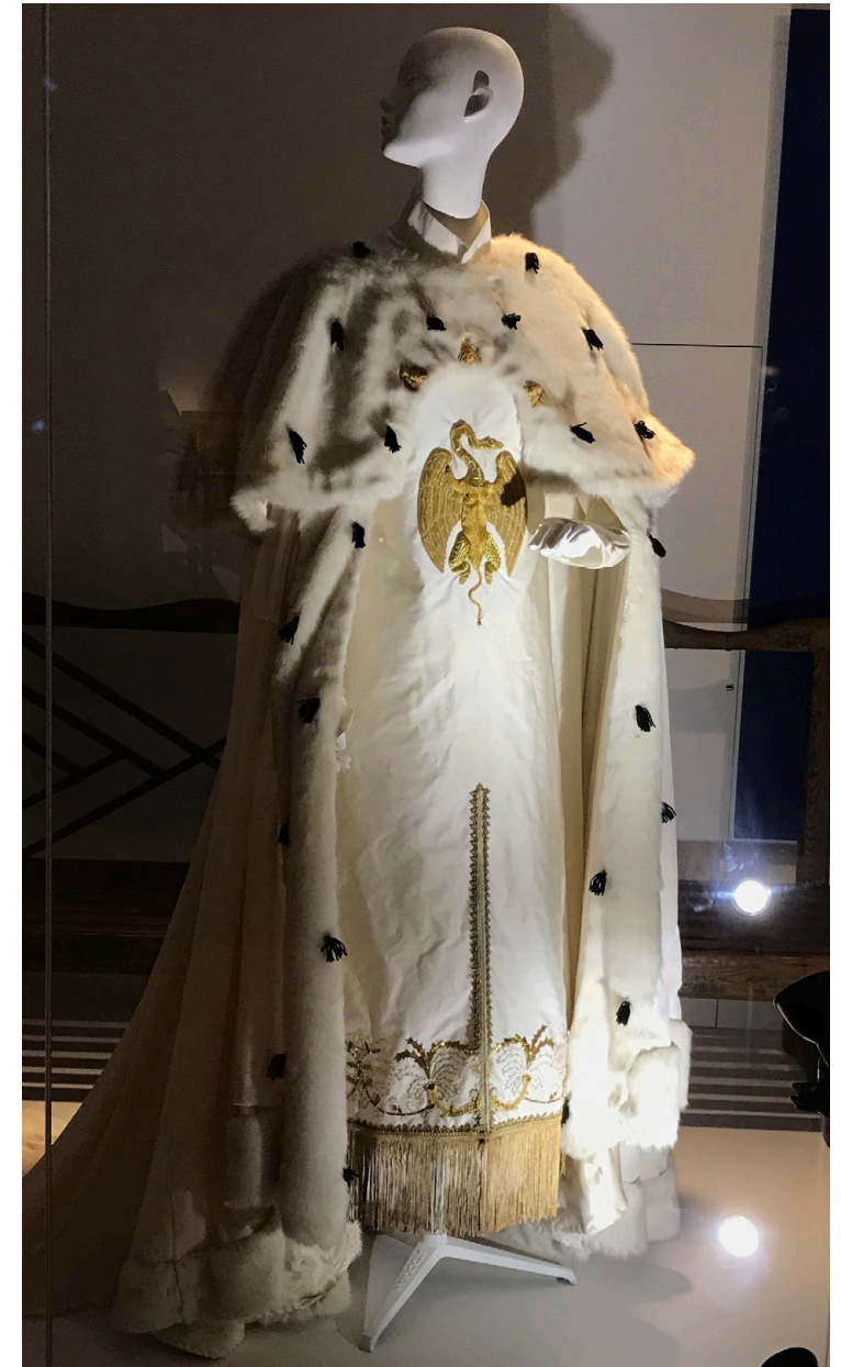
Création exposée du 20 septembre au 18 octobre 2021 au château de Malmaison.

À travers le prisme du manteau de sacre de l'empereur, j'aspire à mettre en exergue la surenchère de préciosité omniprésente dans le mobilier et le vestiaire empire.