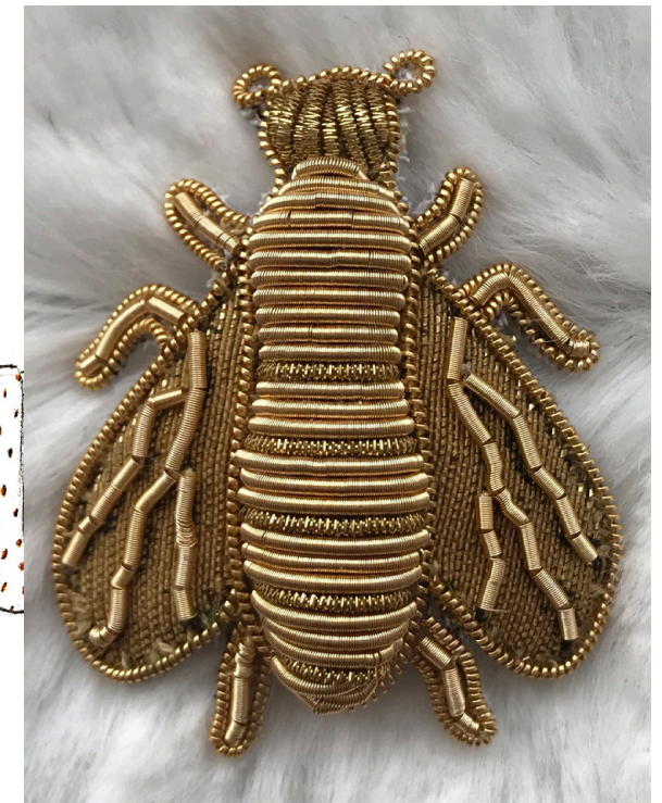
Abeille, réalisation : 25h de broderie or