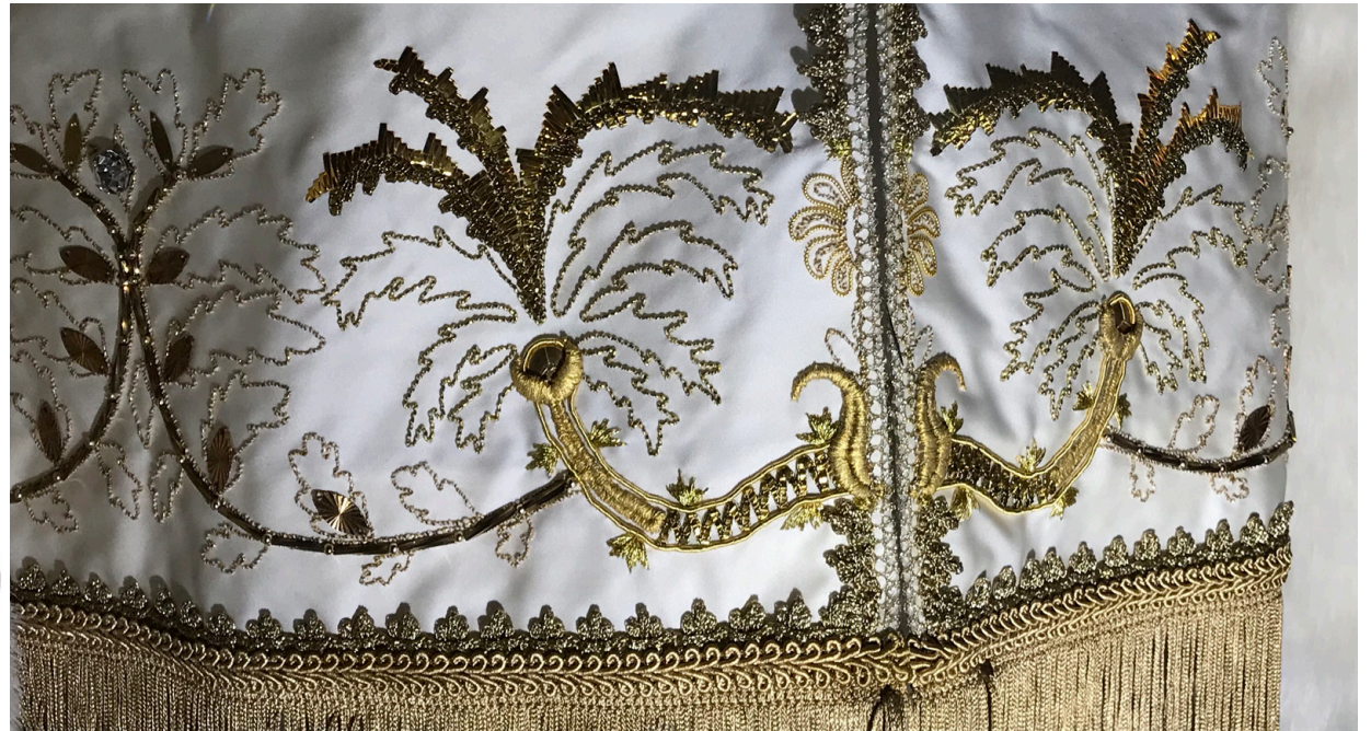
Palmiers et feuilles de chêne, réalisation : 200h de broderie or