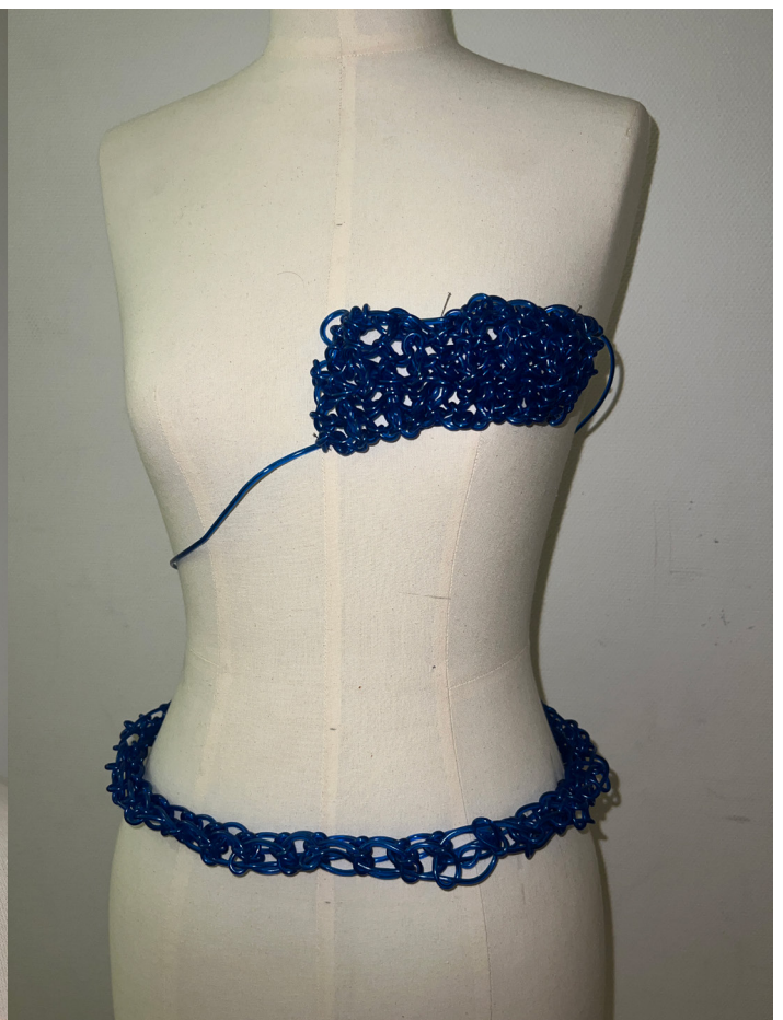
PLACEMENT ON THE BODY