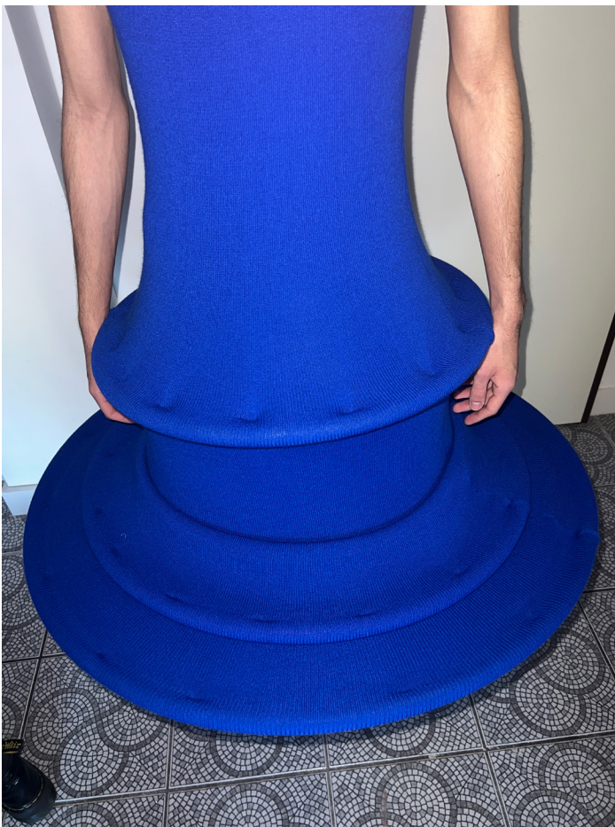
WORK IN PROGRESS