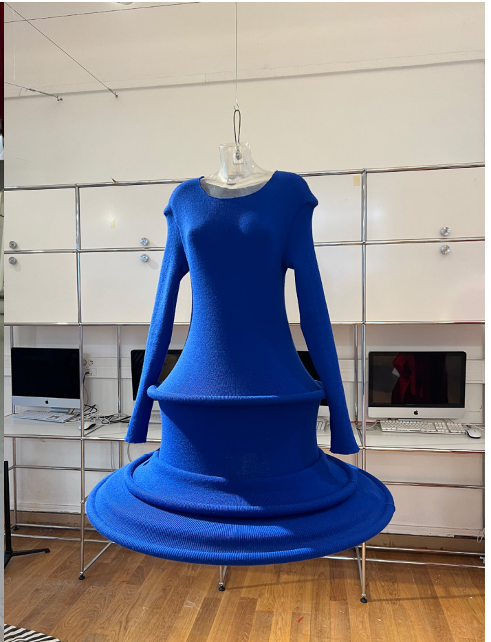
KNIT WOOL DRESS