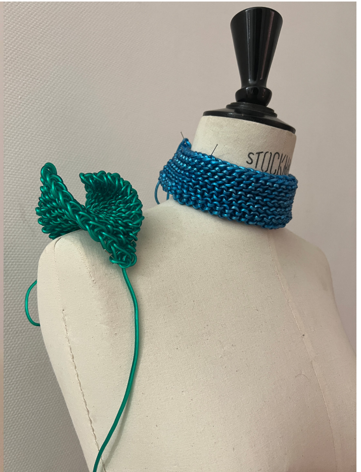
SHOULDER PAD AND HIGH NECK