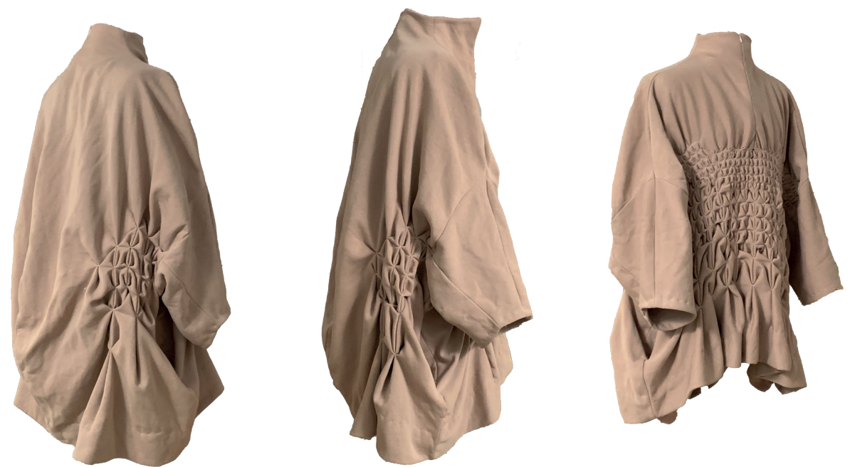
Revêtement dermique Coton, polyester et surteintures végétales