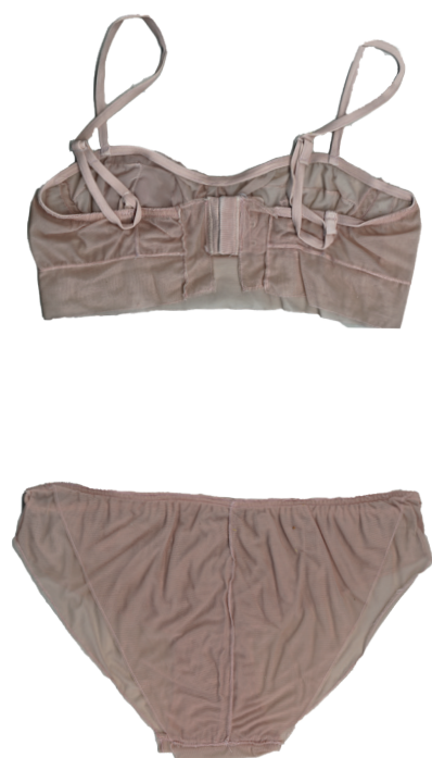
Revêtement Hypodermique Tulle, mousseline et teintures végétales