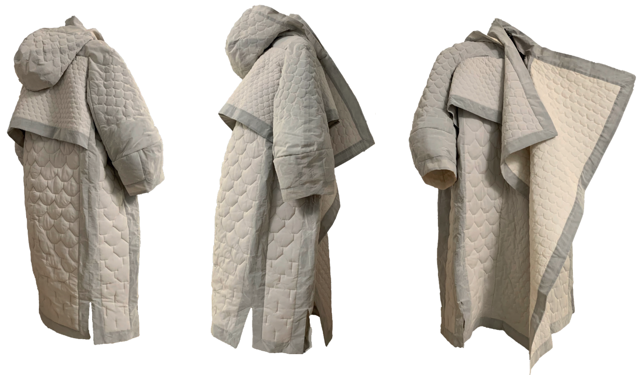
Revêtement Epidermique Mousselines grises et roses thermocollées, ouatine en polyester