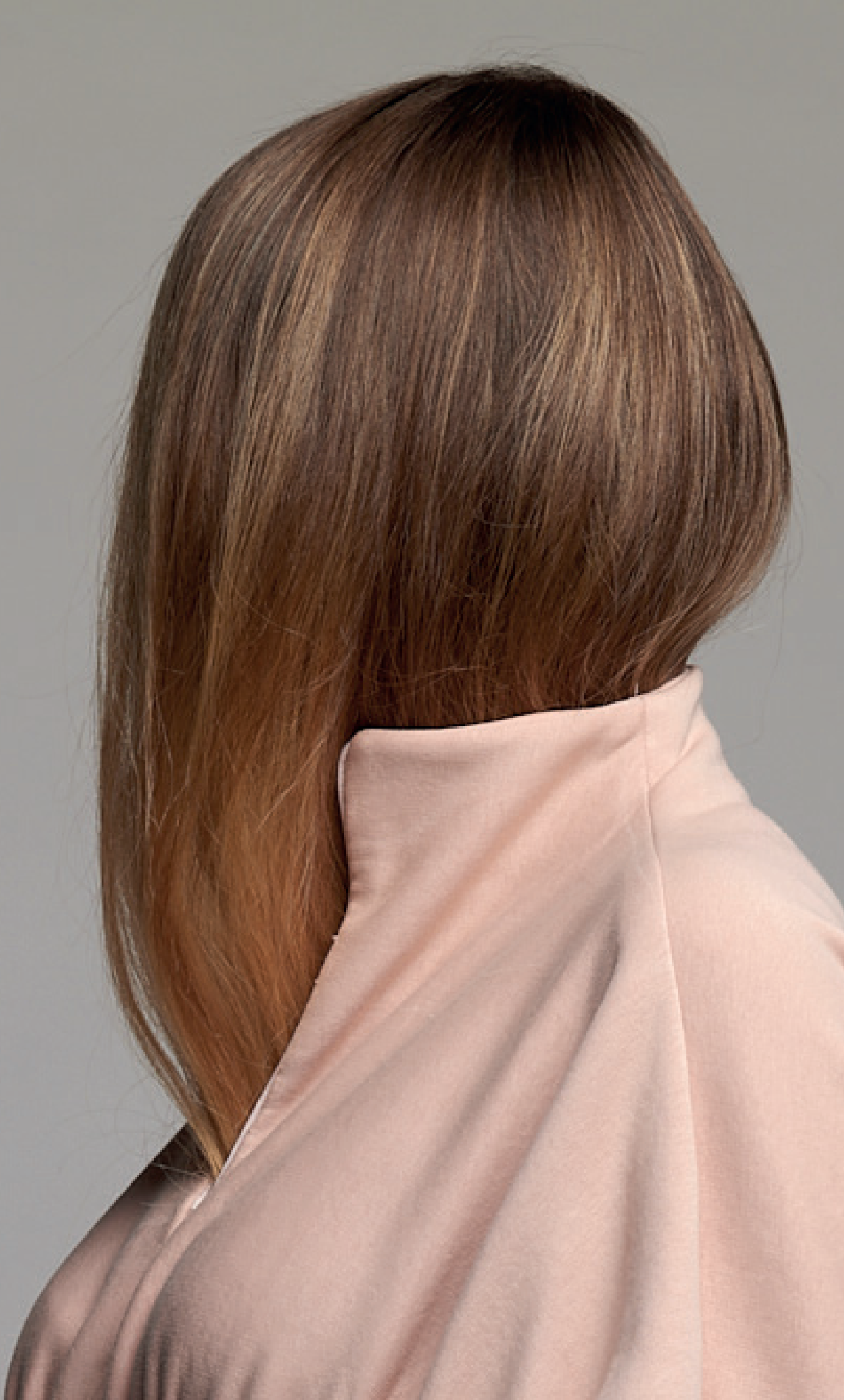
Les tissages Perrin - Toile 100% SE, Soie