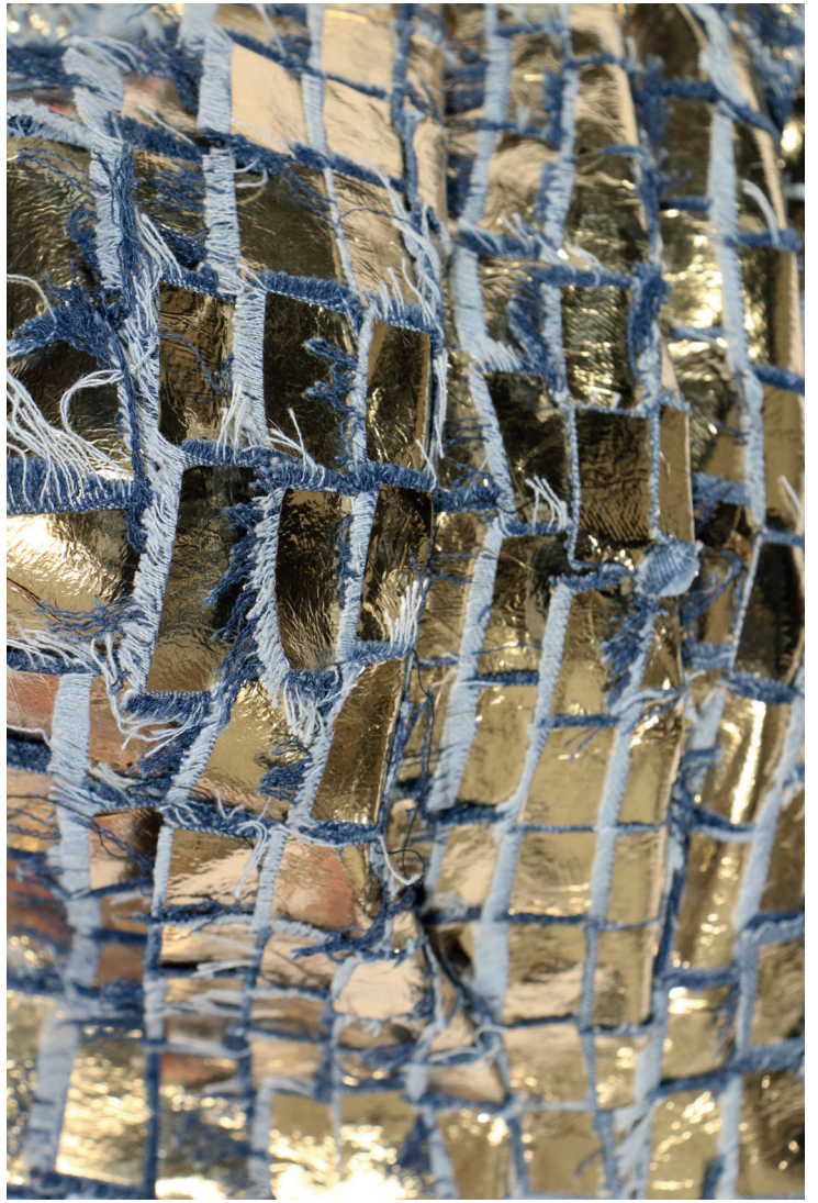
Échantillons Maille / Cotte de Mailles