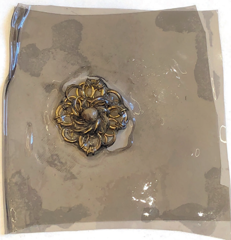
PLASTIQUE FONDU AVEC BIJOUX INTÉGRÉS